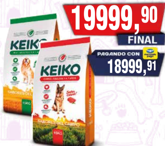
AL.ANIM KEIKO ADUL.x15 kg Pcio.x kg/l: 1333,33 Cod: 19896-19897