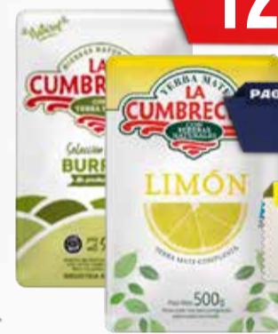
YERBA LA CUMBRE BUR-LIM-NAR X 500g

Pcio.x kg/l: 2599,80 Cod: 5144-28228-23429-23428