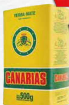
YERBA CANARIAS X 500 GR