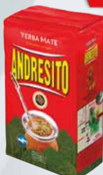
YERBA ANDRESITO X 500 GR