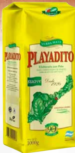
YERBA PLAYADITO X 1 kg