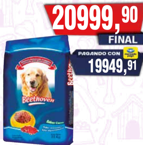
AL.ANIM BEETHOVEN PERRO ADUL x22 kg Pcio.x kg/l: 954,54 Cod: 19893