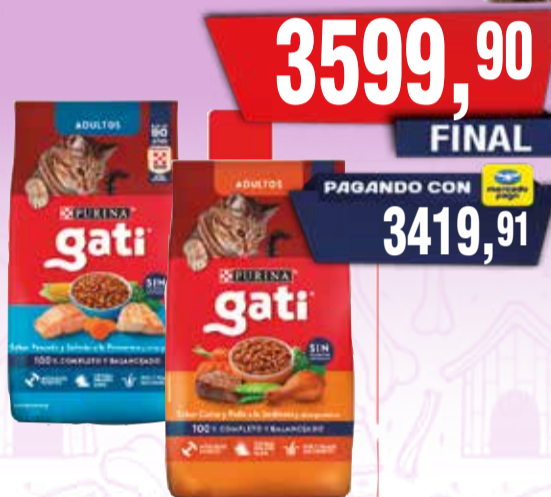
AL.ANIM GATI PESCYSLM./POLLO x1 kg Pcio.x kg/l: 3599,90 Cod: 7645-26924