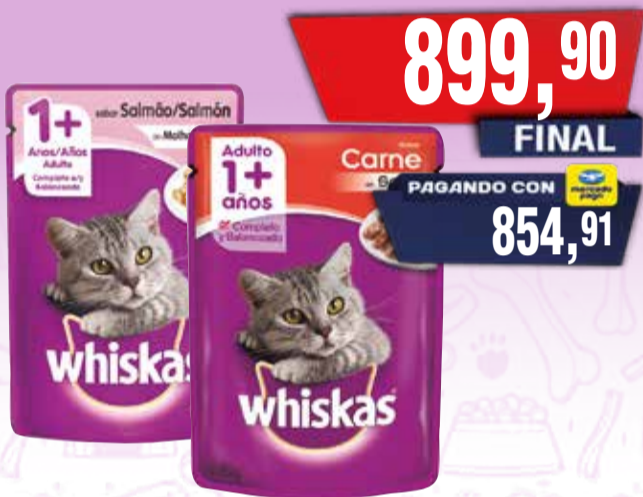
AL.ANIM WHISKAS POUCH x 85gr Pcio.x kg/l: 10587,06 Cod: 26321-23082-28715-26322-