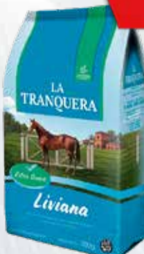
YERBA LA TRANQUERA x500 GR