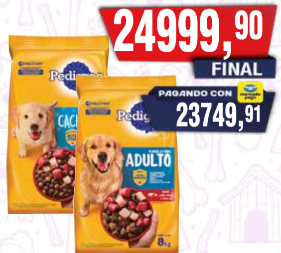
AL.ANIM PEDIGREE x8 kg Pcio.x kg/l: 3124,99 Cod: 26319-26320