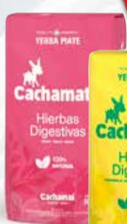
YERBA CACHAMATE AMAR-ROSA-H. SERR.X 1KG

Pcio.x kg/l: 2499,80 Cod: 8933-16559-27200