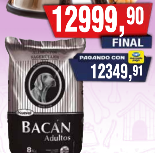
AL.ANIM BACAN MORD.PEQ. x10 kg Pcio.x kg/l: 1299,99 Cod: 18310