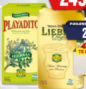
YERBA PLAYADITO COMP/LIEBIG X 500 GR