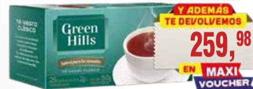
TE G.HILLS x25 saq