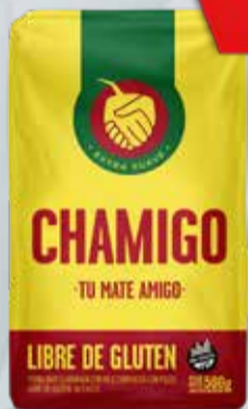
YERBA CHAMIGO x 500 gr.