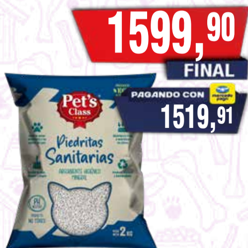
PIEDRAS PETSCLASS SANITARIAS x2 kg Pcio.x kg/l: 799,95 Cod: 28803