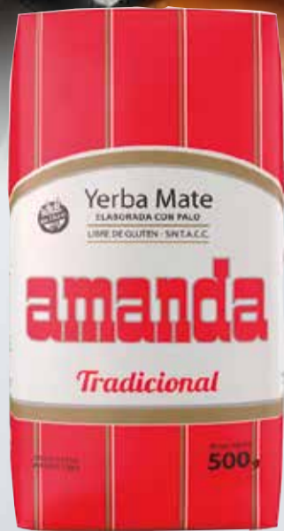
YERBA AMANDA x500 gr