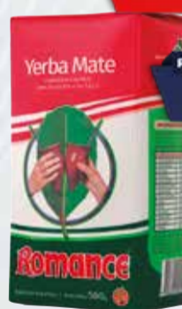
YERBA ROMANCE X 500 GR