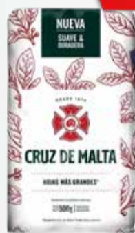
YERBA CRUZ DE MALTA x 500 gr.