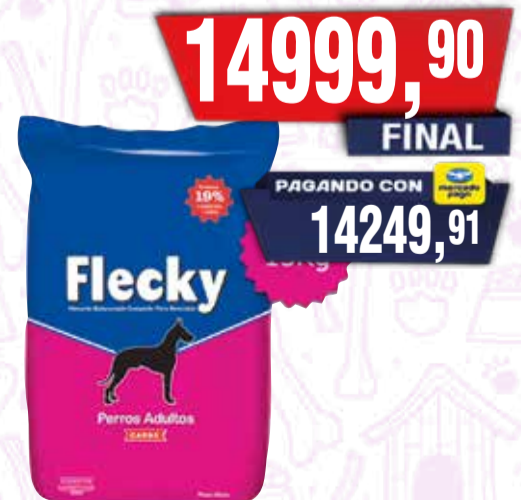
AL.ANIM FLECKY MIX/CARNE ADULTO x15 kg Pcio.x kg/l: 999,99 Cod: 7624-24591