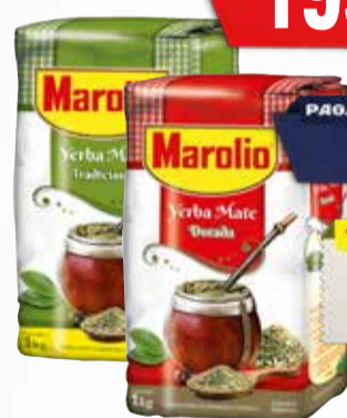
YERBA MAROLIO TRAD-DORADA X 1 KG