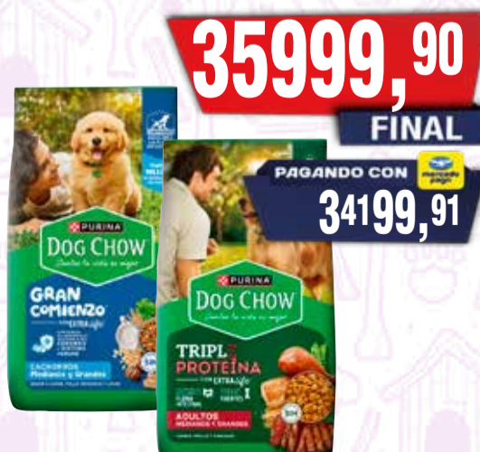
AL.ANIM DOG CHOW AD.MED.GDE x15kg Pcio.x kg/l: 2399,99 Cod: 16568-3434