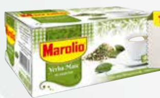
YER SAQ MAROLIO 50 un