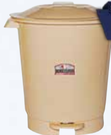
RECIPIENTE RESID. COLOMBRARO TAPA PEDAL 12 lt