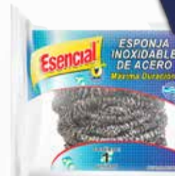
ESPONJA ESENCIAL ACERO 14 gr