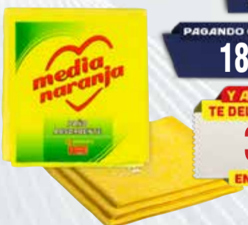
PAÑO MEDIA NJA ABSORB 3 un