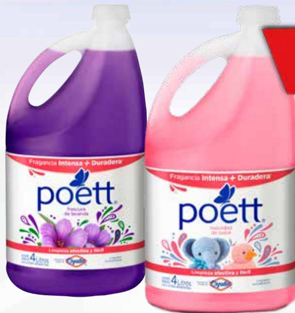
LIMPIADOR POETT X 4 LT

Pcio.x kg/l: 699,98 Cod: 6748-12596-20810-12828