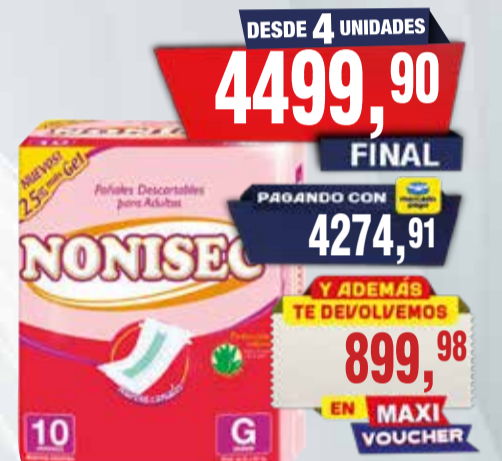
PAÑAL ADULTO NONISEC G x 10u

Pcio.x kg/l: Cod: 26229-26231-27349-26230