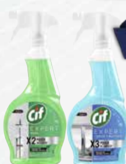
LIMPIADOR LIQUIDO CIF expert 500ml

Pcio.x kg/l: 6599,80 Cod: 931-25387-1510