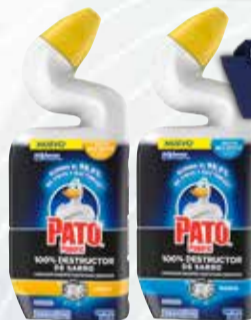
LIMPIADOR CREMOSO PATO GEL ANTISARRO X 500 ML