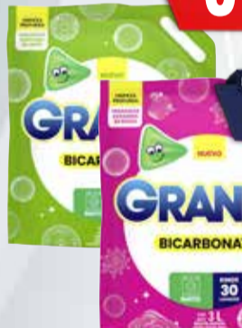
JABON LIQUIDO GRANBY 3lts

Y ADEMÁS TE DEVOLVEMOS 1159,98 EN MAXI VOUCHER