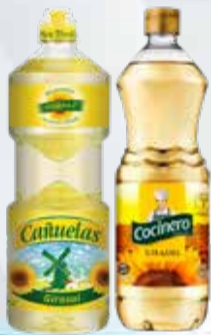
ACEITE GIRASOL CAÑUELAS/ COCINERO x 1,5 lt.