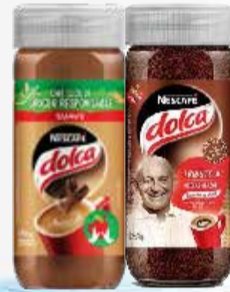
CAFE INSTANTANEO DOLCA TRAD/SUAVE x 170 gr.