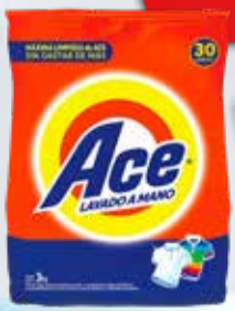
JABON POLVO ACE x 3 kg.