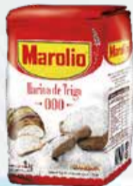
HARINA MAROLIO 000 x 1 kg.