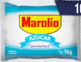
AZUCAR MAROLIO X 1 KG /EXCEPTO PATAGONIA) Pcio.x kg/l: 1099,90 Cod: 322