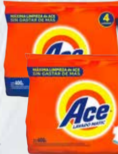
JABON POLVO ACE X 400 GR

Y ADEMÁS TE DEVOLVEMOS 1239,98 EN MAXI VOUCHER