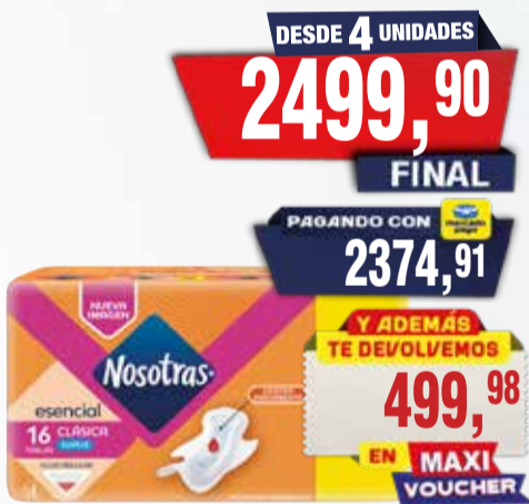
TOALLITAS FEMENINAS NOSOTRAS ESEN x 16u