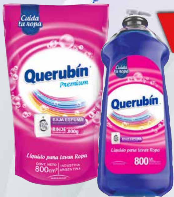
JABON LIQUIDO QUERUBIN 800ml