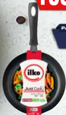
SARTEN ILKO JUST COOK 30cm