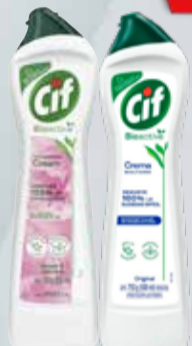
LIMPIADOR CREMOSO CIF 750g

Pcio.x kg/l: 3999,87 Cod: 837-24365-12320