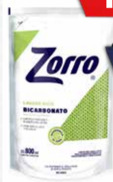
JABON LIQUIDO ROPA ZORRO D/PACK X 800 ML

Y ADEMÁS TE DEVOLVEMOS 1799,98 EN MAXI VOUCHER