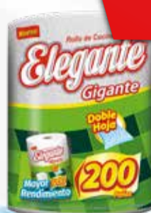
ROLLO DE COCINA ELEGANTE x 200 un.