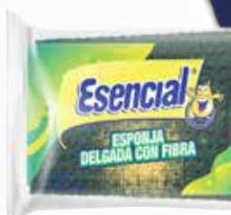
FIBRAS ESENCIAL LISA DELGAD