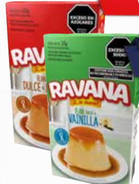
FLAN RAVANA VS SAB X 60 Grs Pcio.x kg/l: 9998,33 Cod: 16991-22179-16992