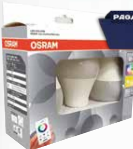
LAMPARA LED OSRAM/LEDVANCE 9w 3un