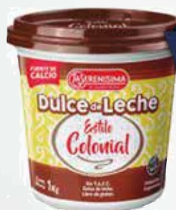
D.LECHE LA SERENISIMA COLONIAL 1KG (exp. Com. Rivadavia y Bariloche) Pcio.x kg/l: 7599,90 Cod: 21768