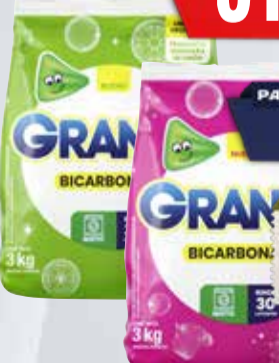
JABON POLVO GRANBY 3kg

Y ADEMÁS TE DEVOLVEMOS 319,98 EN MAXI VOUCHER