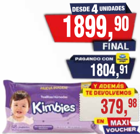
TOALLITAS HUMEDAS KIMBIES W x 48u