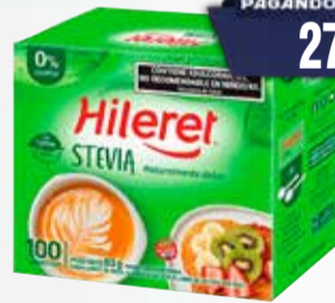
EDULCORANTE SOBRES STEVIA X 100 SOBRES Pcio.x kg/l: 28999,00 Cod: 23122