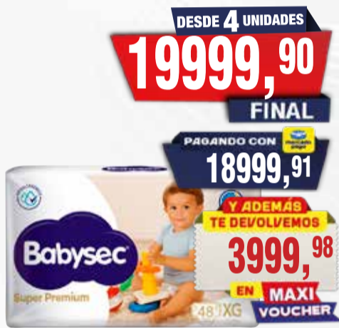
PAÑALES BABYSEC superpremium 44-48-60u