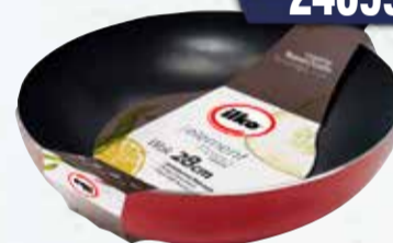
WOK ILKO ROSSO 28cm