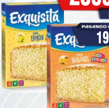
BIZCOCHUELO EXQUISITA x 540 gr. Pcio.x kg/l: 3888,70 Cod: 504-564-554