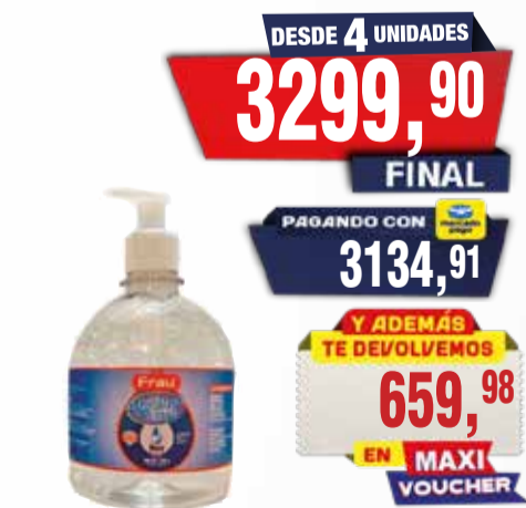
ALCOHOL FRAU EN GEL X 500 cc