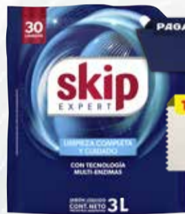
JABON LIQUIDO SKIP 3lts

Y ADEMÁS TE DEVOLVEMOS 1319,98 EN MAXI VOUCHER