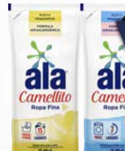
DETERGENTE P/ROPA ALA 450ml d/p

Y ADEMÁS TE DEVOLVEMOS 6599,98 EN MAXI VOUCHER