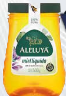
MIEL ALELUYA X 500 GR Pcio.x kg/l: 11999,80 Cod: 15361