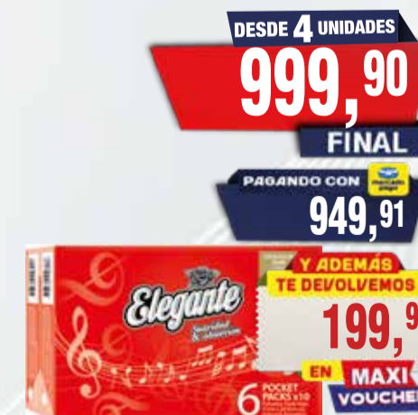
PAÑUELOS ELEGANTE 6x10u