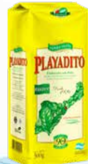
YERBA PLAYADITO x 500 gr.