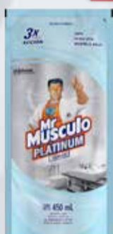
LIMPIADOR VIDRIOS M.MUSCULO VID.MULT. 450 ml