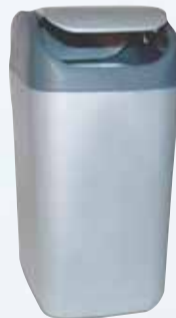
RECIPIENTE RESID. COLOMBRARO VAIVEN 9LT