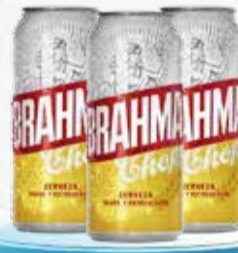
CERVEZA BRAHMA x 473 cc.