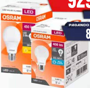
LAMPARA LED OSRAM/LEDVANCE 5W