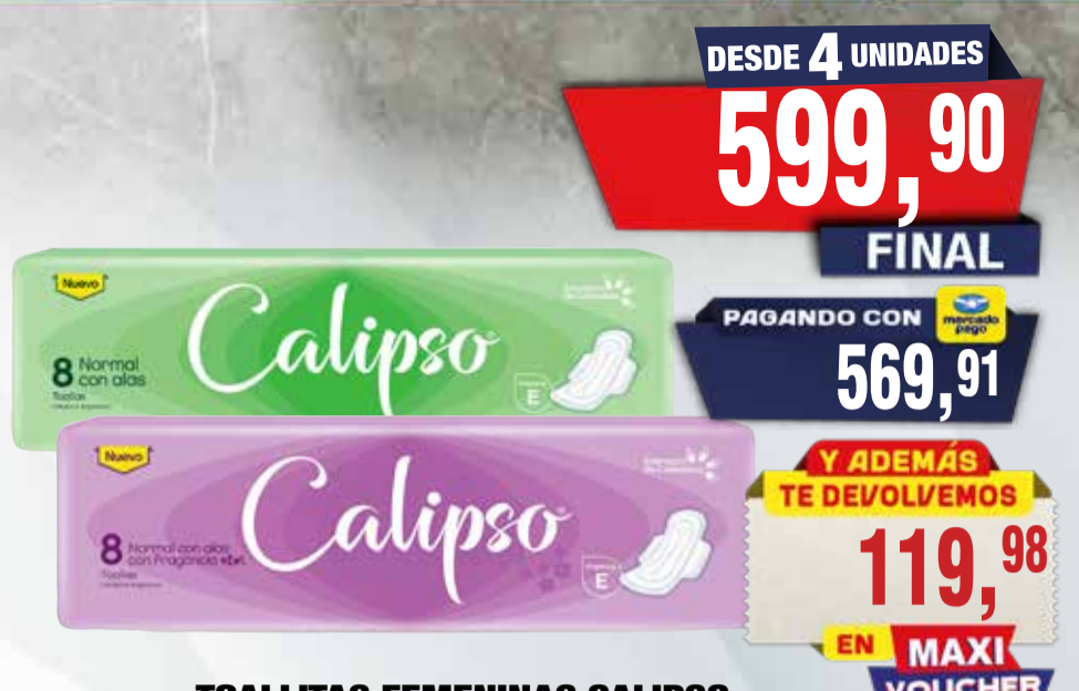
TOALLITAS FEMENINAS CALIPSO C.ALAS x 8u

Pcio.x kg/l: Cod: 15296-15297-23488-15298