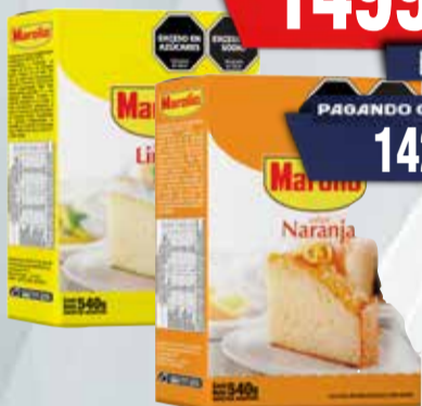
BIZCOCHUELO MAROLIO ESTUCHE X 540 Grs Pcio.x kg/l: 2777,59 Cod: 24995-24996-23453