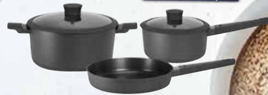
BATERIA COCINA HUDSON DAILY 5PZ