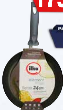
SARTEN ILKO ROSSO 24cm