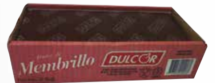
DULCE DULCOR MEMBRILLO 2 kg Pcio.x kg/l: 3299,95 Cod: 14873