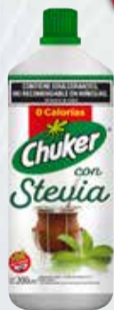
EDULCORANTE LIQUIDO CHUKER STEVIA X 200 CC Pcio.x kg/l: 10999,50 Cod: 24679