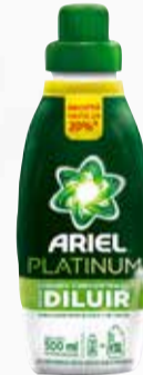
JABON LIQUIDO ROPA ARIEL PLATINUM DILUIR X 500 ml

Y ADEMÁS TE DEVOLVEMOS 399,98 EN MAXI VOUCHER