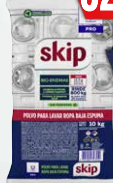
JABON POLVO SKIP 10kg

Y ADEMÁS TE DEVOLVEMOS 1099,98 EN MAXI VOUCHER