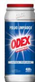
LIMPIADOR POLVO ODEX 400g