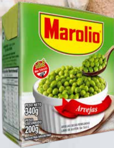
ARVEJAS MAROLIO T/RECART X 340 Grs Pcio.x kg/l: 1176,18 Cod: 21637