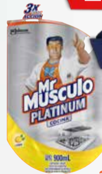
LIMPIADOR M.MUSCULO PLATIN D.P 900 ml