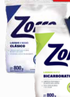
JABON POLVO ZORRO X 800 GR

Y ADEMÁS TE DEVOLVEMOS 239,98 EN MAXI VOUCHER