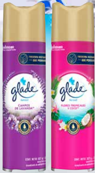
DESODOR. GLADE X 380 CC

Pcio.x kg/l: 6578,68 Cod: 6368-6316-14465-23067-