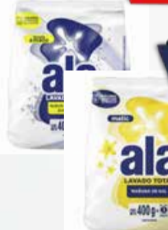
JABON POLVO ALA 400g

Y ADEMÁS TE DEVOLVEMOS 183,98 EN MAXI VOUCHER