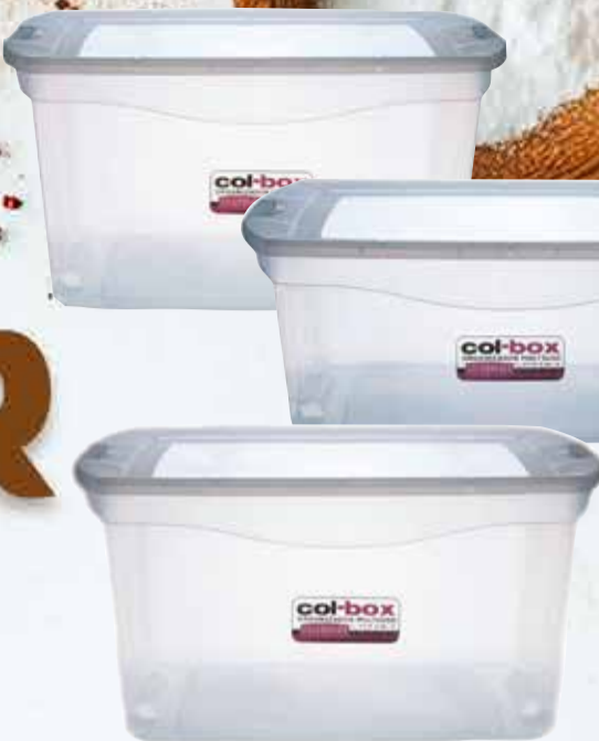
CONTENEDORES COLOMBRARO COLBOX Pcio.x kg/l: Cod: 21483-21480-21482-21481