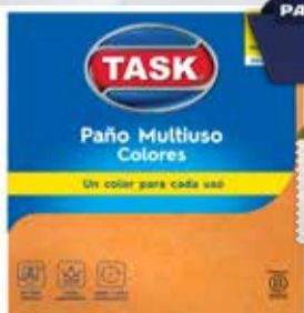
PAÑO TASK MULT/COLOR 3 un