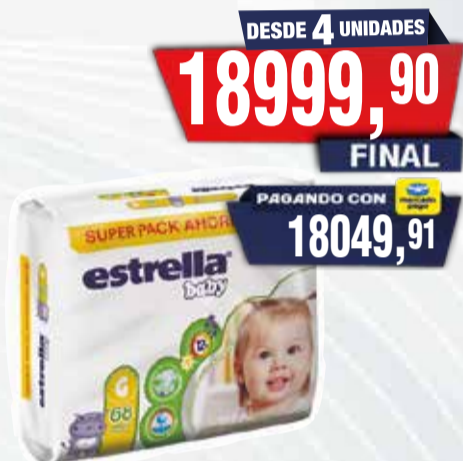
PAÑAL BEBE ESTRELLA SUP PACK

Pcio.x kg/l: Cod: 26229-26231-27349-26230