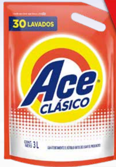
JABON LIQUIDO ROPA ACE D/PACK X 3 LT

Y ADEMÁS TE DEVOLVEMOS 399,98 EN MAXI VOUCHER