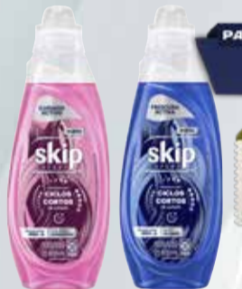
JABON LIQUIDO SKIP 800ml botella

Y ADEMÁS TE DEVOLVEMOS 1199,98 EN MAXI VOUCHER