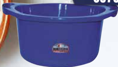
FUENTON COLOMBRARO ITALIANO 12 lt