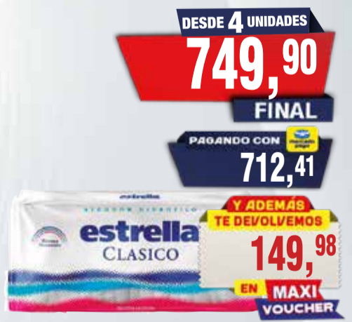
ALGODÓN ESTRELLA CLAS x 75 GR