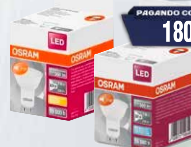
LAMPARA LEDVANCE GU10 7W