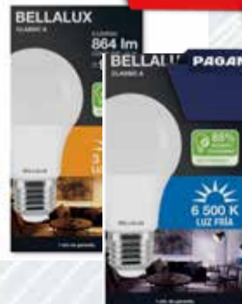
LAMPARA LED BELLALUX 12W