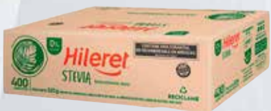
EDULCORANTE SOBRES HILERET STEVIA X 400 SOBRES Pcio.x kg/l: 10999,90 Cod: 22235