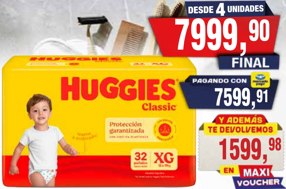
PAÑAL BEBE HUGGIES CLAS JUMB

Pcio.x kg/l: Cod: 15296-15297-23488-15298