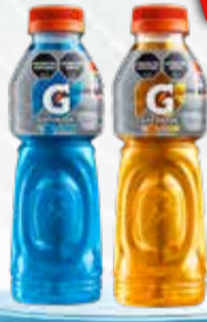
BEBIDA ISOTONICA GATORADE x 500 cc (Solo Amba)

Pcio.x kg: 2799,80 Cod: 15279-14924-14922-15280-15281