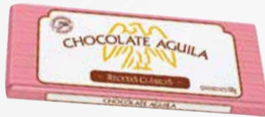
CHO.TAZ AGUILA x100 gr Pcio.x kg/l: 36999,00 Cod: 2205