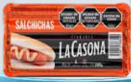
SALCHICHAS LA CASONA x 6 un.