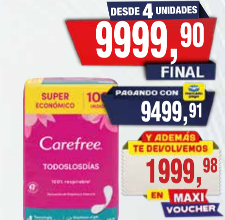
PROTECTORES FEMENINOS CAREFREE T.DIAS x 100u