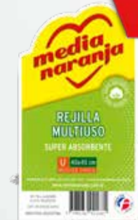
REJILLA MEDIA NARANJA MULTIUSO