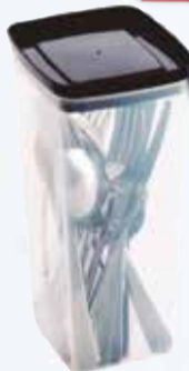
SET CUBIERTOS SIMONAGGIO ACERO 24PZ Pcio.x kg/l: Cod: 26658