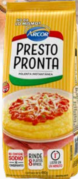
POLENTA PRESTOPRONTA X 490 GR

Y ADEMÁS TE DEVOLVEMOS 79,98 EN MAXI VOUCHER