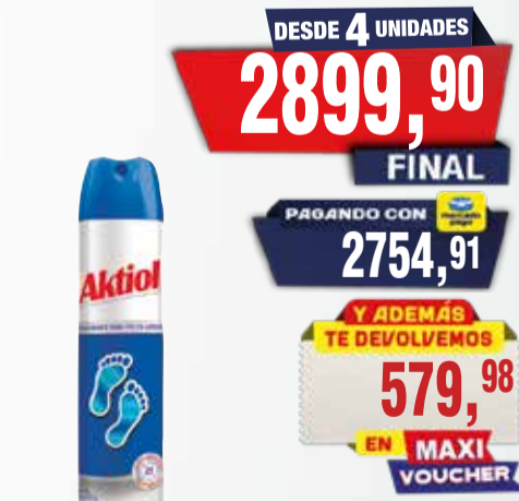
TALCO AKTIOL aero 150ml