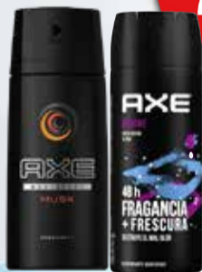
DESODORANTE AXE x 150 ml.

Pcio.x kg: 18666,00 Cod: 2822-2823-20727-21834-21753-16391