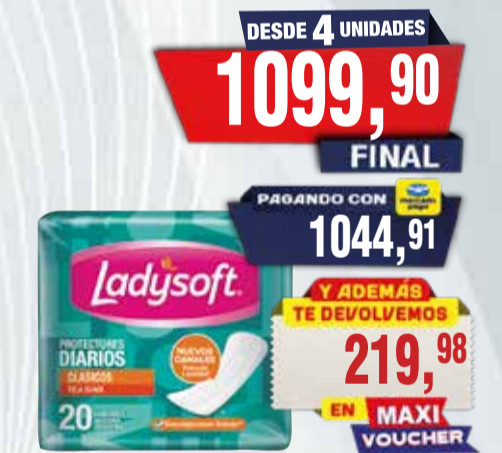
PROTECTORES FEMENINOS LADYSOFT 20u