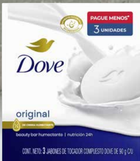
JABON DOVE 3x90g