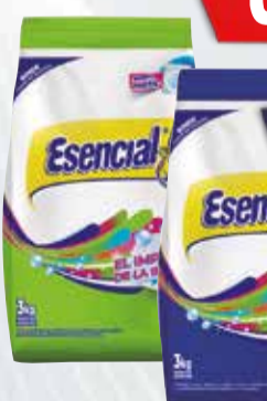
JABON POLVO ESENCIAL X 3 K

Y ADEMÁS TE DEVOLVEMOS 1039,98 EN MAXI VOUCHER