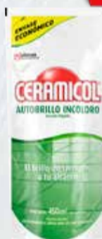
AUTOBRILLO PISOS CERAMICOL D/ PACK X 450 ML