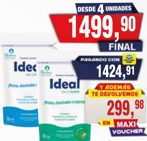
TOALLITAS HUMEDAS IDEAL x 50u