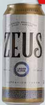
CERV. ZEUS x 473 cc