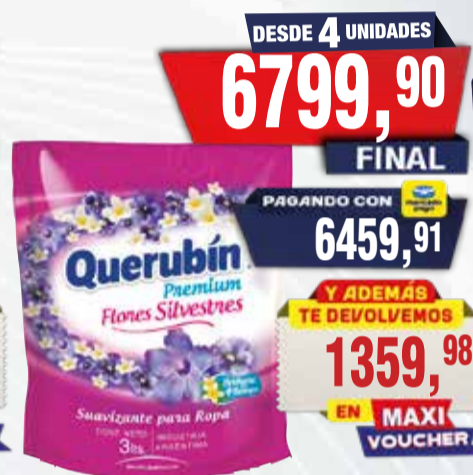
ENJUAGUE QUERUBIN 3lts Pcio.x kg/l: 2266,63 Cod: 22227