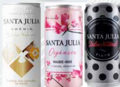
VINO STA. JULIA LATAS x 269 cc