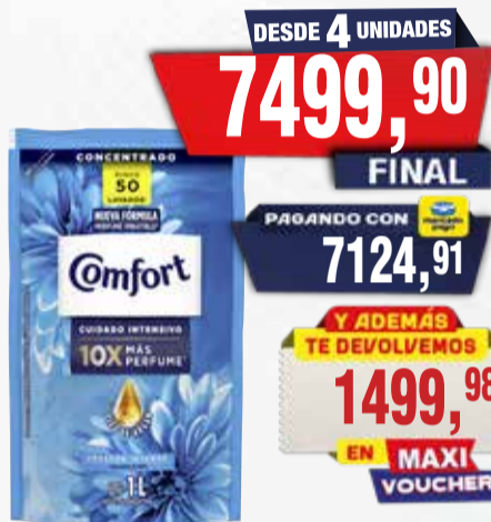
ENJUAGUE COMFORT 1lt concentrado d/p Pcio.x kg/l: 7499,90 Cod: 23630-786