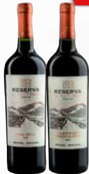
VINO RES.D.ANDES VARIETALES x 750 cc