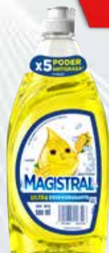
DETERGENTE MAGISTRAL X 500 ML Pcio.x kg/l: 5999,80 Cod: 578-623-25640

Y ADEMÁS TE DEVOLVEMOS 599,98 EN MAXI VOUCHER