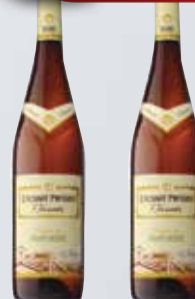
VINO ETCHART PRIVTTES 750 cc