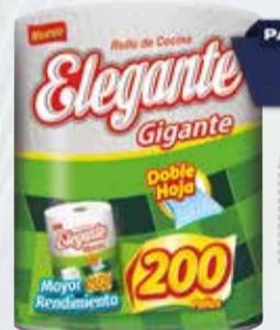
ROLLO COCINA ELEGANTE 200paños Pcio.x kg/l: 9,00 Cod: 28770

Y ADEMÁS TE DEVOLVEMOS 359,98 EN MAXI VOUCHER