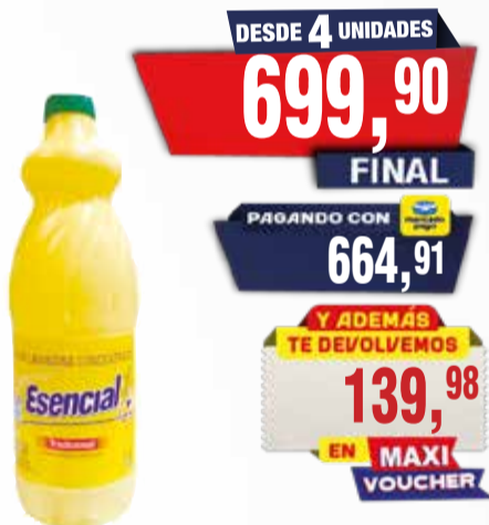
LAVANDINA ESENCIAL TRADICIONAL 1 lt Pcio.x kg/l: 699,90 Cod: 11539