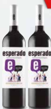
VINO ESPERADO VAR. x 750 cc