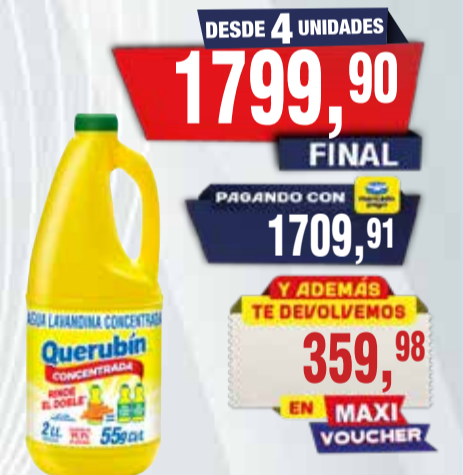
LAVANDINA QUERUBIN concentrada 2lt Pcio.x kg/l: 899,95 Cod: 26572