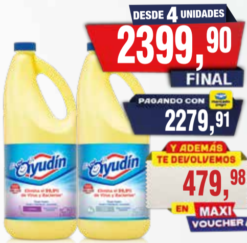
LAVANDINA AYUDIN TRIPLE PODER X 2 LT Pcio.x kg/l: 1199,95 Cod: 359-379