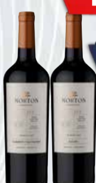
VINO NORTON BAR. SELECT VAR. x 750 cc