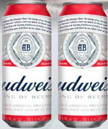
CERV. BUDWEISER 710 cc