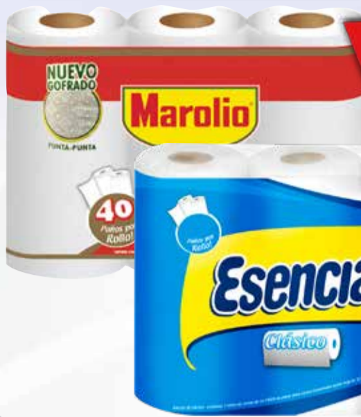
ROLLO COCINA MAROLIO-ESENCIAL 3x40mts Pcio.x kg/l: 9,00 Cod: 7723-13337

Y ADEMÁS TE DEVOLVEMOS 379,98 EN MAXI VOUCHER