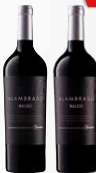
VINO ALMABRADO VAR. x 750 cc