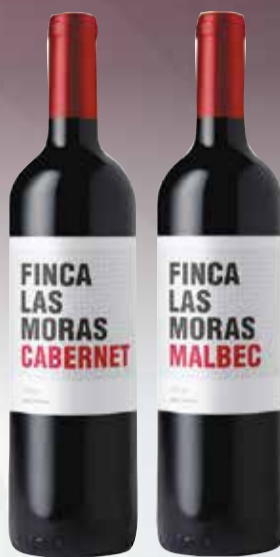
VINO FCA. LAS MORAS VARIETAL x750cc