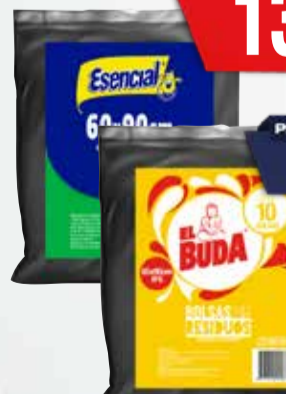
BOLSA CONSORCIO ESENCIAL Y BUDA 60 X 90 CM Pcio.x kg/l: 1399,90 Cod: 15761-12443

Y ADEMÁS TE DEVOLVEMOS 279,98 EN MAXI VOUCHER