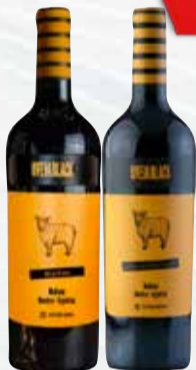
VINO OVEJA BLACK VARIETAL x 750 cc