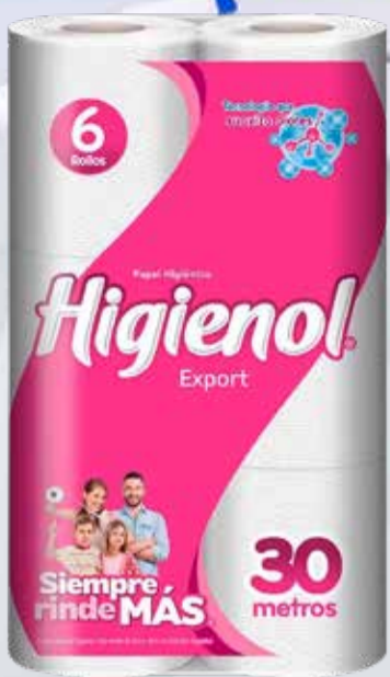
PAPEL HIGIENICO HIGIENOL fresh 6x30mts Pcio.x kg/l: 10,56 Cod: 15835