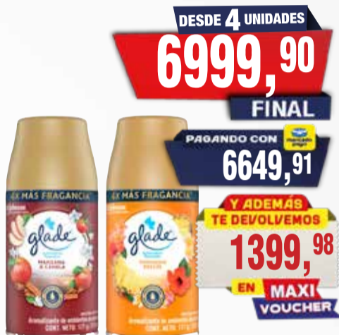
REPUESTO GLADE AUTOMATICO X 270 ML Pcio.x kg/l: 25925,56 Cod: 22037-21790-21789-22038