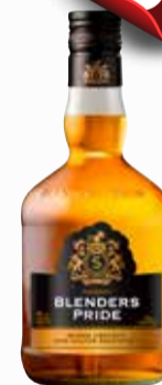
WHISKY BLENDERS x 750 cc