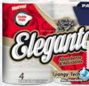
PAPEL HIGIENICO ELEGANTE DH 4x20mts Pcio.x kg/l: 20,86 Cod: 50327

Y ADEMÁS TE DEVOLVEMOS 333,80 EN MAXI VOUCHER