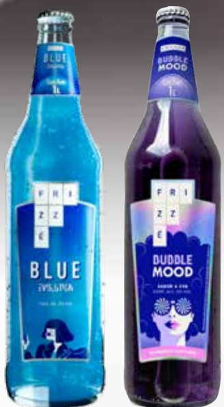
APERIT. FRIZZE X 750 CC