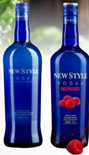
VODKA NEW STYLE EVOLUTION 1 lt

Pcio.x kg/l: 3999,90 Cod: 5871-28773-28774