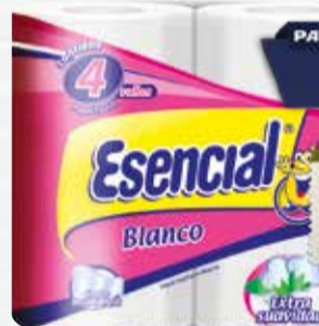
PAPEL HIGIENICO ESENCIAL blanco 4x30mts Pcio.x kg/l: 10,83 Cod: 13689

Y ADEMÁS TE DEVOLVEMOS 259,98 EN MAXI VOUCHER