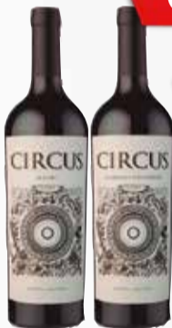
VINO CIRCUS VARIETALES x750cc