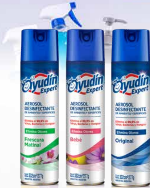
DESINFECTANTE AYUDIN X 332 CC

Pcio.x kg/l: 6325,00 Cod: 2486-17188-15233