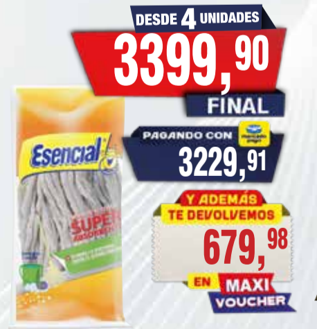
MOPA ESENCIAL BLANCA PISO Pcio.x kg/l: 3399,90 Cod: 23138