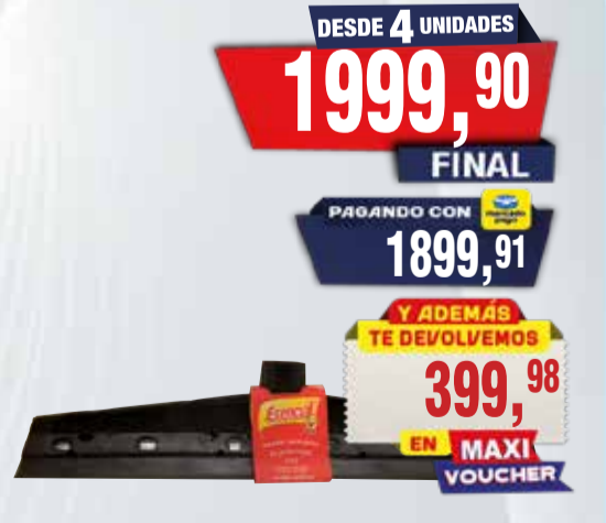
SECADOR ESENCIAL NEGRO N*40 Pcio.x kg/l: 1999,90 Cod: 18114