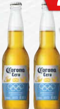
CERV. CORONA 0.0 330 cc