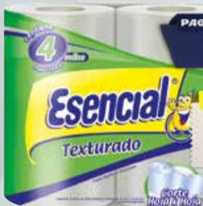
PAPEL HIGIENICO ESENCIAL texturado 4x30mts Pcio.x kg/l: 9,17 Cod: 13673

Y ADEMÁS TE DEVOLVEMOS 219,98 EN MAXI VOUCHER