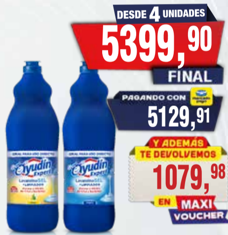
LAVANDINA AYUDIN GEL X 1,5 LT Pcio.x kg/l: 3599,93 Cod: 24456-24455