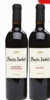
VINO STA.ISABEL VARIETAL x 750 cc