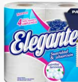
PAPEL HIGIENICO ELEGANTE HS 4x30mts Pcio.x kg/l: 10,75 Cod: 28765

Y ADEMÁS TE DEVOLVEMOS 257,98 EN MAXI VOUCHER