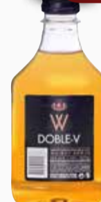
LICOR DOBLE V PET. x 200 cc