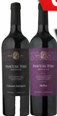
VINO PASC. TOSO x750 ml