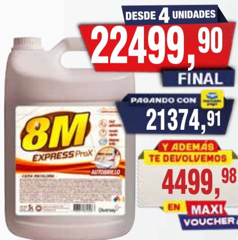
AUTOBRILLO PISOS 8 M X 5 LT Pcio.x kg/l: 4499,98 Cod: 16666