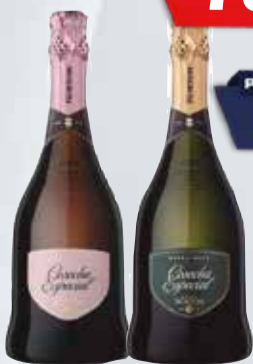
CHAMP. NORTON COSECHA ESP. x 750 cc