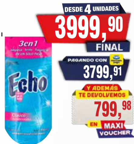
AUTOBRILLO PISOS ECHO D/PACK X 450 ML Pcio.x kg/l: 8888,67 Cod: 759