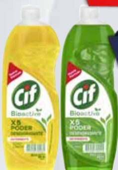
LAVAVAJILLAS CIF 500ml Pcio.x kg/l: 4999,80 Cod: 20966-18336

Y ADEMÁS TE DEVOLVEMOS 499,98 EN MAXI VOUCHER