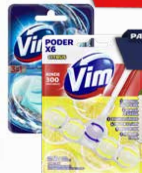
CANASTA INODOROS VIM x6 50g Pcio.x kg/l: 59998,00 Cod: 25330-3855-23856

Y ADEMÁS TE DEVOLVEMOS 599,98 EN MAXI VOUCHER