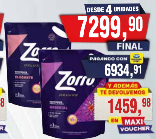
ENJUAGUE ZORRO D/PACK X 3 LT Pcio.x kg/l: 2433,30 Cod: 27988-27989