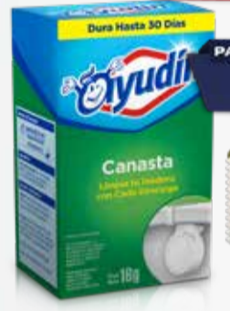
DESODORANTE INODORO AYUDIN 16 gr Pcio.x kg/l: 143743,75 Cod: 2679

Y ADEMÁS TE DEVOLVEMOS 459,98 EN MAXI VOUCHER