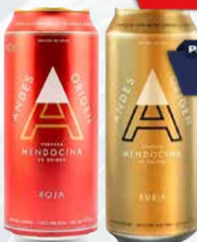
CERV. ANDES 473 cc