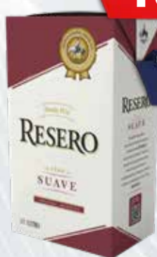
VINO RESERO TTO.SUAVE x 1 lt