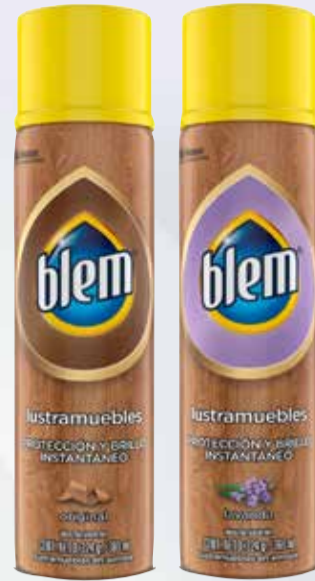
LUSTRAMUEBLES BLEM X 360 CC