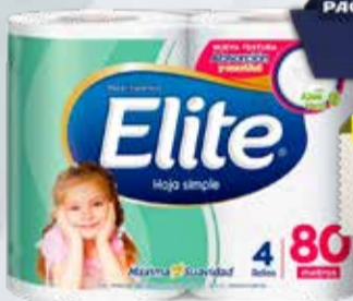
PAPEL HIGIENICO ELITE 4x80mts Pcio.x kg/l: 12,50 Cod: 15801

Y ADEMÁS TE DEVOLVEMOS 799,98 EN MAXI VOUCHER