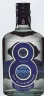
ANIS 8 HNOS. AZUL.DCE. x 1 lt