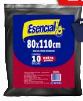
BOLSA RESIDUOS ESENCIAL Y EL BUDA 80 X 110 CM Pcio.x kg/l: 2699,90 Cod: 15762-24719

Y ADEMÁS TE DEVOLVEMOS 539,98 EN MAXI VOUCHER