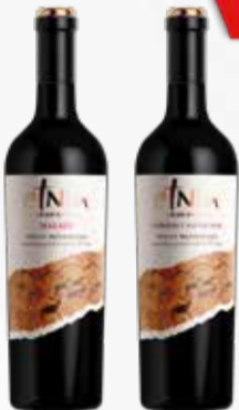
VINO ETNIA GRAN ROBLE x750cc