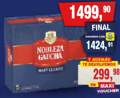
NOBLEZA GAUCHA Mate cocido x 50 unidades x 100 g Pcio.x kg: 30,00 Cod: 28140