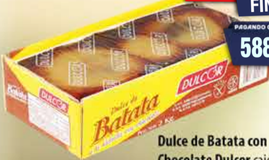
Dulce de Batata con Chocolate Dulcor cajón 2 kg Pcio.x kg: 3099,95 Cod: 23045