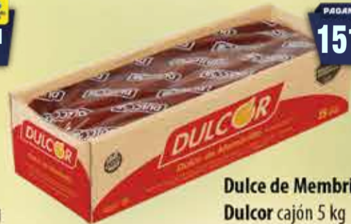
Dulce de Membrillo Dulcor cajón 5 kg Pcio.x kg: 3199,98 Cod: 28149