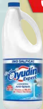
LAVANDINA AYUDIN ANTISPLASH X 2 LT Pcio.x kg/l: 1599,95 Cod: 22338