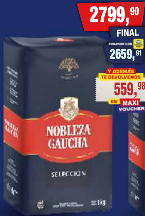
NOBLEZA GAUCHA Selección x 1 kg Pcio.x kg: 2799,90 Cod: 26383-1926