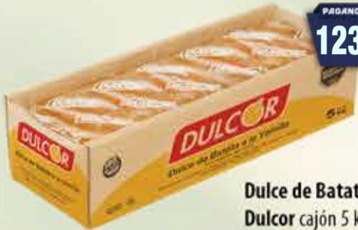
Dulce de Batata Dulcor cajón 5 kg Pcio.x kg: 2599,98 Cod: 28148