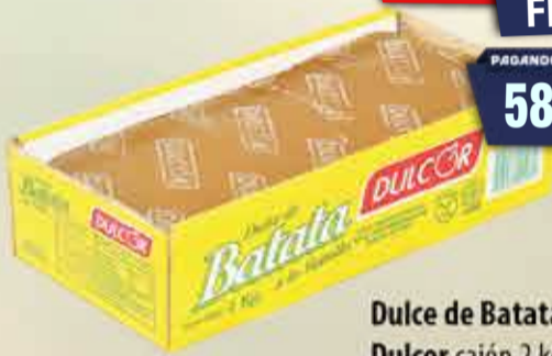
Dulce de Batata Dulcor cajón 2 kg Pcio.x kg: 3099,95 Cod: 23044