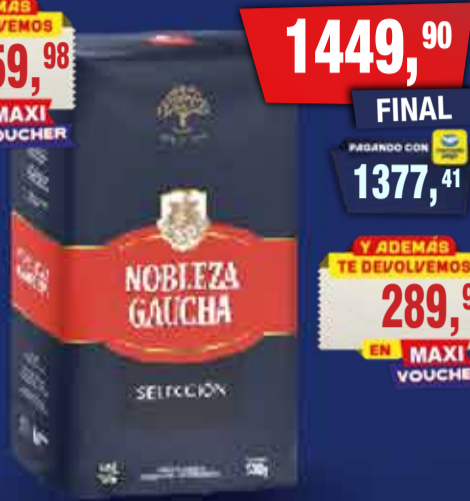
NOBLEZA GAUCHA Selección x 500 g Pcio.x kg: 2899,80 Cod: 26382-1950