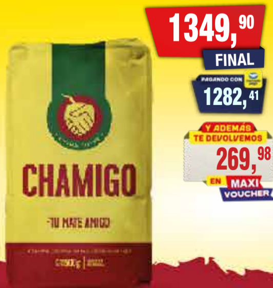
CHAMIGO x 500 g Pcio.x kg: 2699,80 Cod: 1857