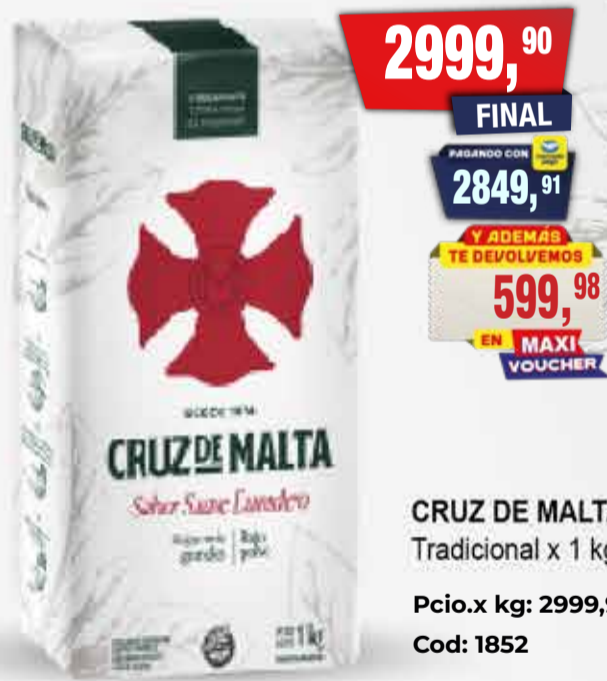
CRUZ DE MALTA Tradicional x 1 kg Pcio.x kg: 2999,90 Cod: 1852