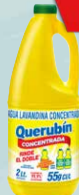
LAVANDINA QUERUBIN concentrada 2lt Pcio.x kg/l: 899,95 Cod: 26572