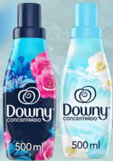
ENJUAGUE DOWNY x 500 cc

Pcio.x kg/l: 1299,97 Cod: 25638-27197-27497-28976