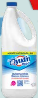
LAVANDINA AYUDIN ROP.BCA.INT 2 lt Pcio.x kg/l: 4999,86 Cod: 6132