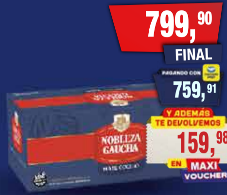
NOBLEZA GAUCHA Mate cocido x 25 unidades x 50g Pcio.x kg: 32,00 Cod: 27412