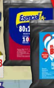
BOLSA RESIDUOS ESENCIAL Y EL BUDA 80 X 110 CM Pcio.x kg/l: 3399,90 Cod: 15762-12442