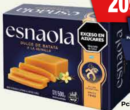
Dulce de Batata Esnaola estuche 500 g Pcio.x kg: 4199,80 Cod: 23047-26249