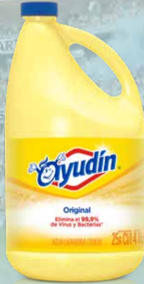
LAVANDINA AYUDIN CLASICA X 4 LT

Pcio.x kg/l: 1299,97 Cod: 25638-27197-27497-28976