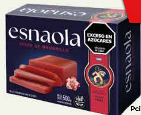
Dulce de Membrillo Esnaola estuche 500 g Pcio.x kg: 3799,98 Cod: 26250