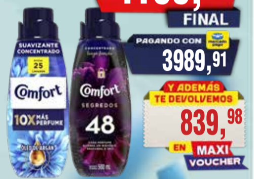
ENJUAGUE COMFORT 500ml d/p Pcio.x kg/l: 8399,80 Cod: 27631-27632-27633-27635-