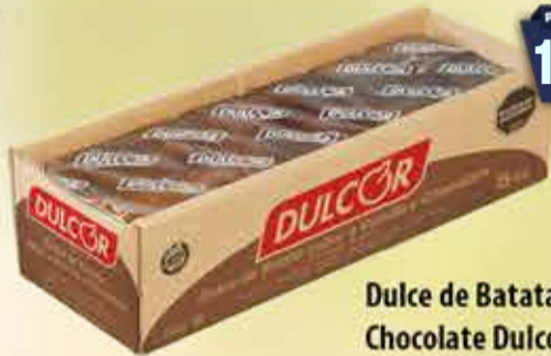
Dulce de Batata con Chocolate Dulcor cajón 5 kg Pcio.x kg: 2599,98 Cod: 28514