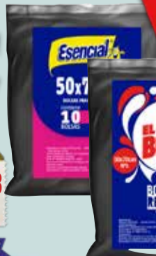
BOLSA RESIDUOS ESENCIAL Y EL BUDA N*5 50X70 cm Pcio.x kg/l: 649,90 Cod: 15765-12446