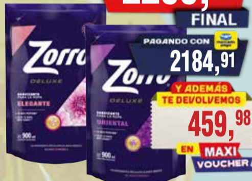
ENJUAGUE ZORRO D/PACK X 900 ML Pcio.x kg/l: 2555,44 Cod: 27987-27986