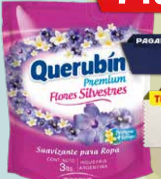
ENJUAGUE QUERUBIN 3lt Pcio.x kg/l: 2499,97 Cod: 22227