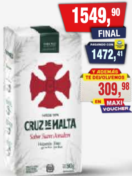
CRUZ DE MALTA Tradicional x 500 g Pcio.x kg: 3099,80 Cod: 1851