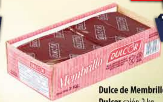
Dulce de Membrillo Dulcor cajón 2 kg Pcio.x kg: 3674,95 Cod: 14873