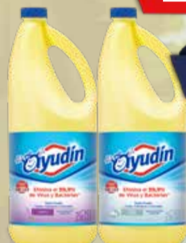
LAVANDINA AYUDIN TRIPLE PODER X 2 LT Pcio.x kg/l: 1299,95 Cod: 359-379