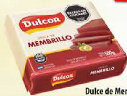
Dulce de Membrillo Dulcor sachet 500 g Pcio.x kg: 4199,80 Cod: 6677