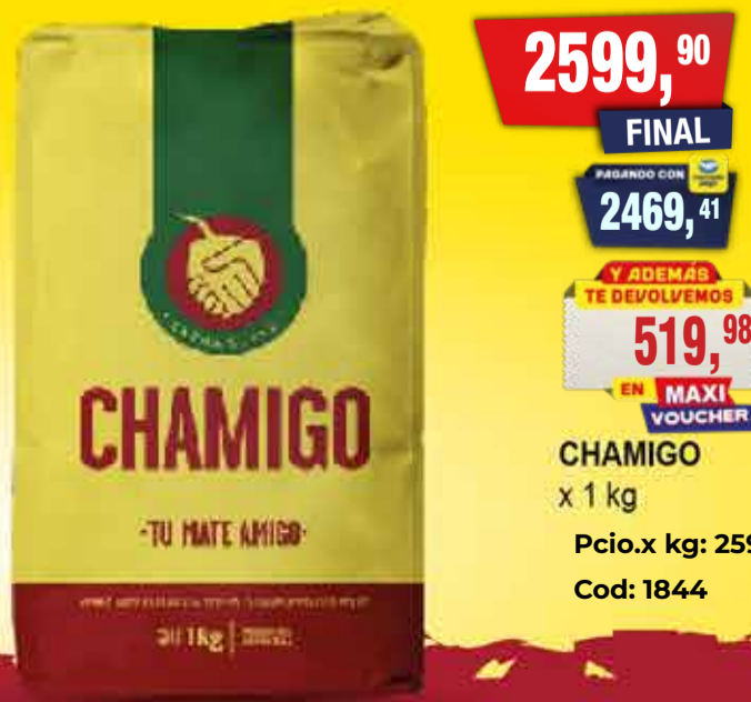
CHAMIGO x 1 kg Pcio.x kg: 2599,90 Cod: 1844