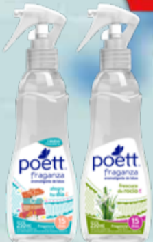
PERFUMERIA ROPA POETT GATILLO X 250 ML Pcio.x kg/l: 15999,60 Cod: 26065-17208-17205-17207-