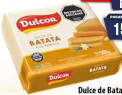
Dulce de Batata Dulcor sachet 500 g Pcio.x kg: 3299,80 Cod: 6200