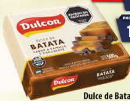
Dulce de Batata con Chocolate Dulcor sachet 500 g Pcio.x kg: 3299,80 Cod: 6202